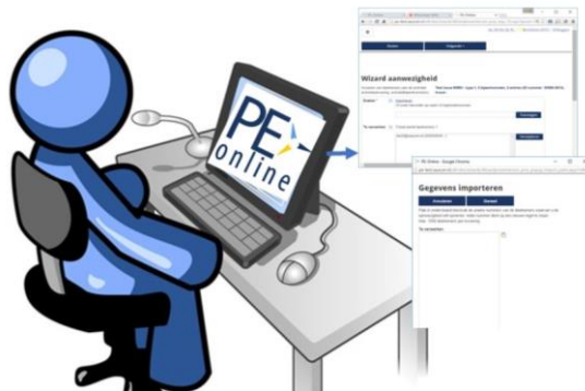
Figuur 1 Presentie via schermen in PE-online

Iedere aanbieder kan dit doen door in te loggen in PE-online en daar de deelnemers toe te voegen. Het is mogelijk de deelnemers op nummer te importeren